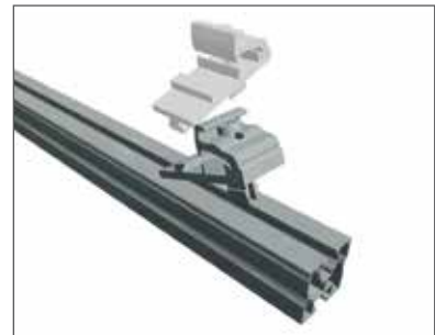
1 Seitlich einhaken und drehen.