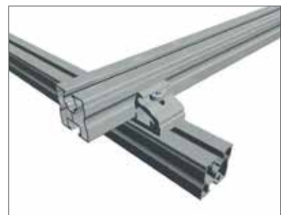
3 Profil auflegen und von oben festschrauben.

Der Rapid Kreuzverbinder (Art.Nr. 129063-000) ist im Gegensatz zu seinem Vorgänger komplett vormontiert. Dadurch wurden die Montageschritte auf ein Minimum reduziert.